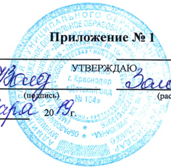
ГРАФИК дежурства сторожей на 201 г.

И.Н. Золотарева (подпись) И.Н. Золотарева (расшифровка подписи) « 9 » января 2019 г.